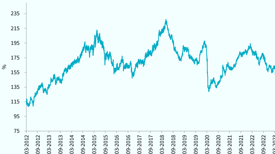
— TCM Africa High Dividend Equity